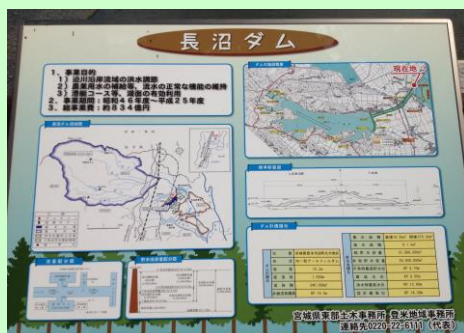
長沼ダム案内表示