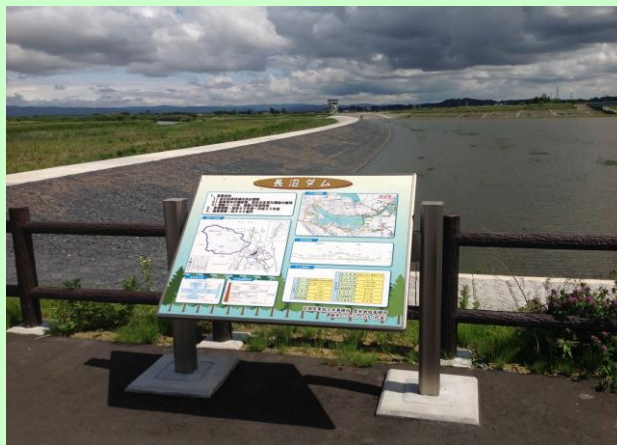
長沼ダム案内表示(壁面用グラフィックス)

工事名 : 長沼ダム導水路天端舗装外工事 発注者 : 宮城県東部土木事務所 登米地域事務所 仕様 : ロメンステッカー 施工地 : 登米市迫町北方 長沼ダム