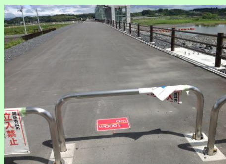
距離表示(出発地点より0m)