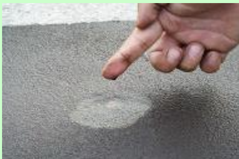
⑤指で施工箇所を押して透明な水が出てくれば、交通開放できます。