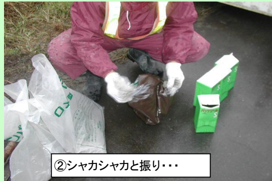
②シャカシャカと振り・・・