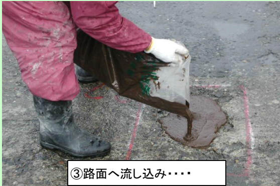
③路面へ流し込み・・・