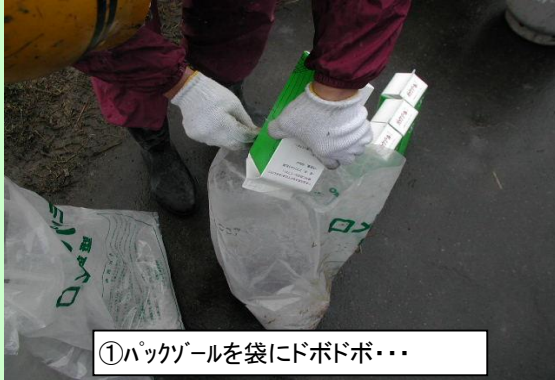
①パックゾールを袋にドボドボ・・・