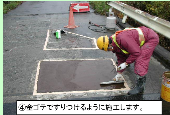
④金ゴテですりつけるように施工します。